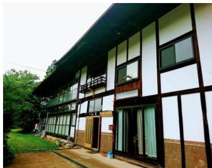
農村 Café やい子ばあちゃん (石川町)