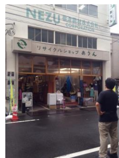
あうんのリサイクルショップ