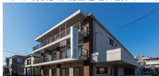
新施設：安心ケアセンター・悠遊えごた