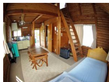
長柄町農村交流センターログハウス