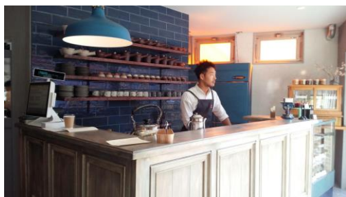
胡桃堂のテイクアウト用カウンター

西国分寺のクルミドコーヒーに続き、2017年国分寺に胡桃堂喫茶店を開店。飲食業界は厳しい。初年度からの成長率は20%、来客数90人/日。地産地消の食材として地元の野菜(コクベジ)も使っている。大切な思いを持っている本を各自持ち寄り売る古書店部分で本の循環を図っている。地域通貨「ぶんじ」を使ってのぶんじ食堂も地域と連携して行っている。